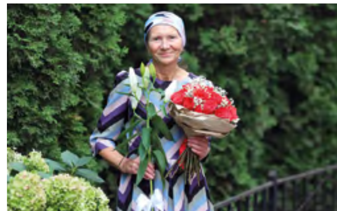
Поздравляем с юбилеем!