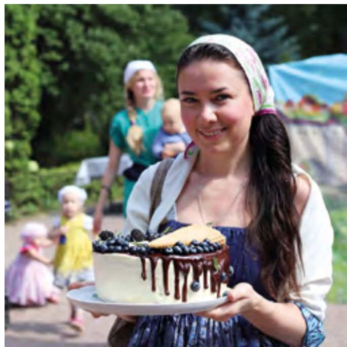
Именинный торт для настоятеля