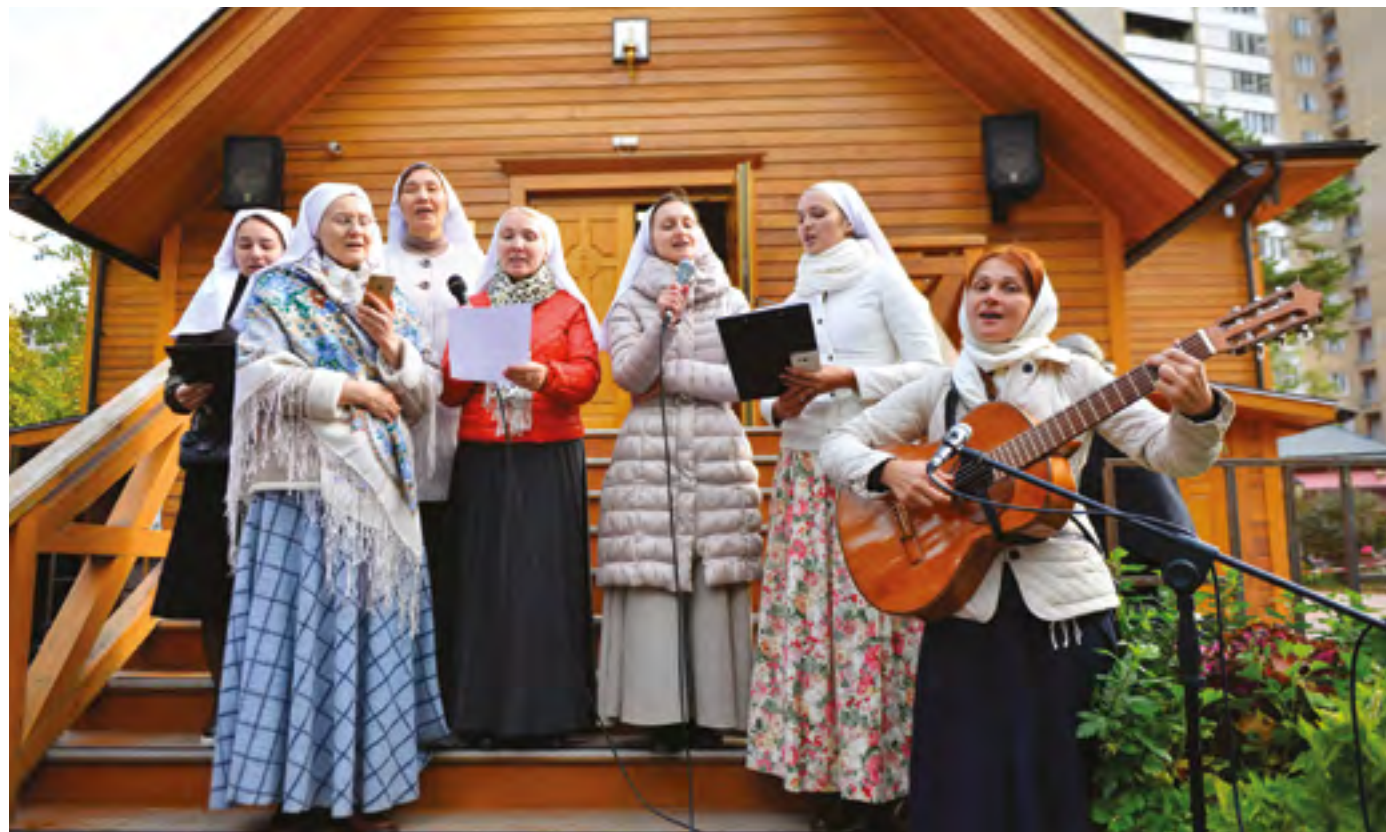
Выступление на приходском празднике «Белый цветок»