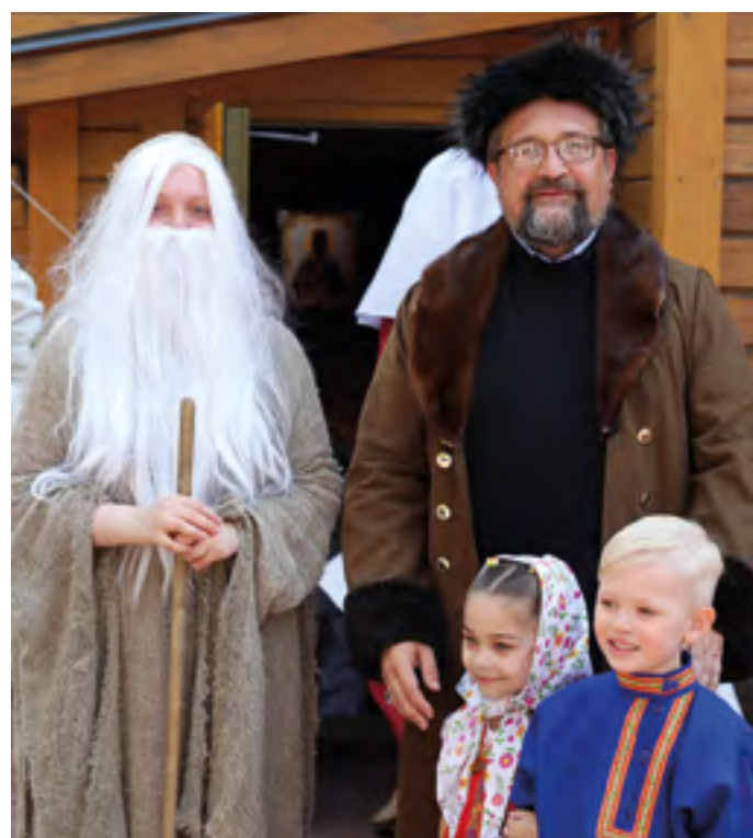
«Вы не узнаете нас в гриме?!»