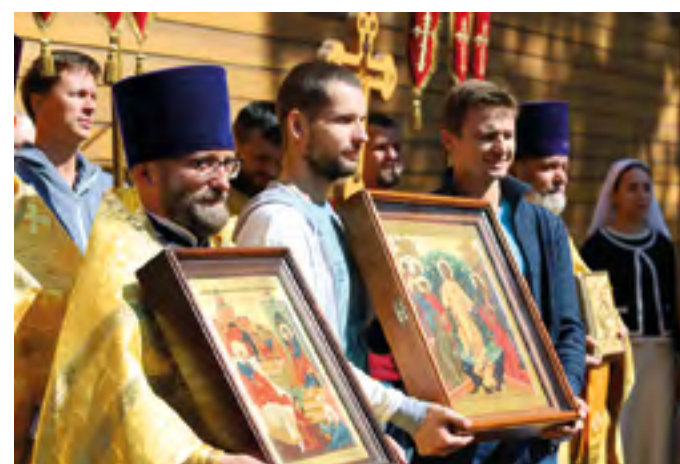
Рождество свт. Николая Мирликийского