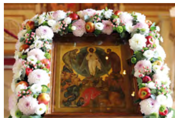
Светлый праздник Преображения Господня