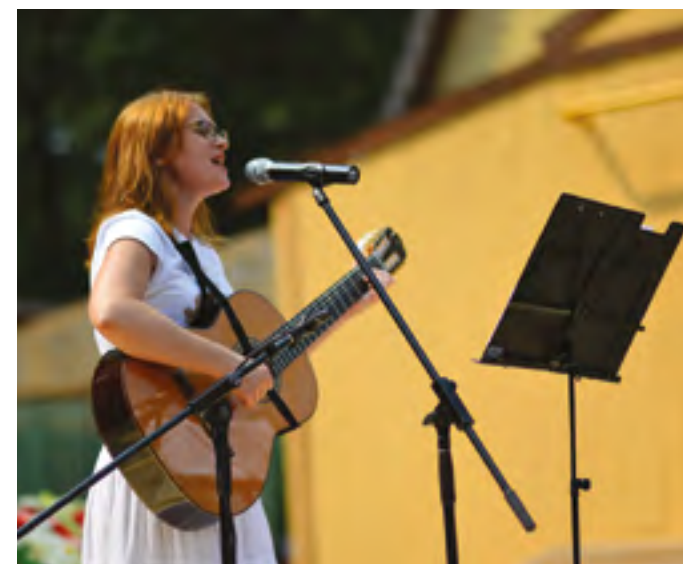
«Отче Николай, ты нам помогай!»

– Благодарим вас за интервью и желаем творческих успехов!