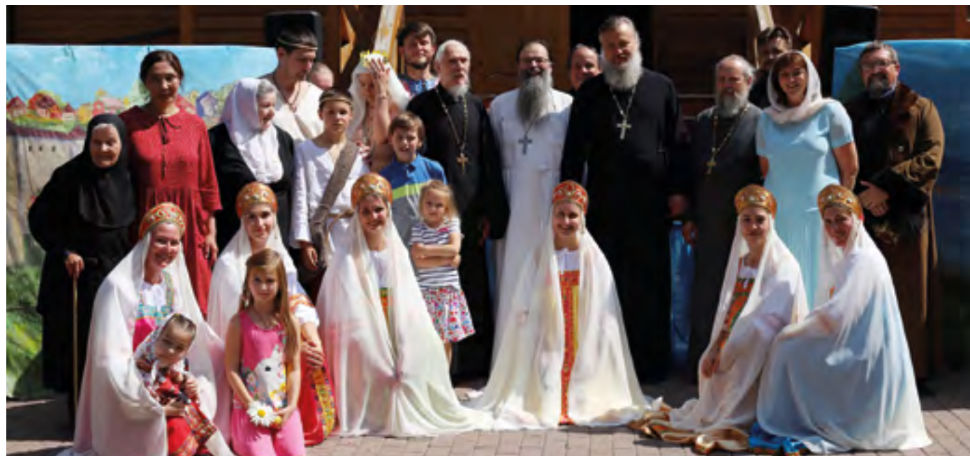
Общее фото в день памяти святого равноапостольного великого князя Владимира