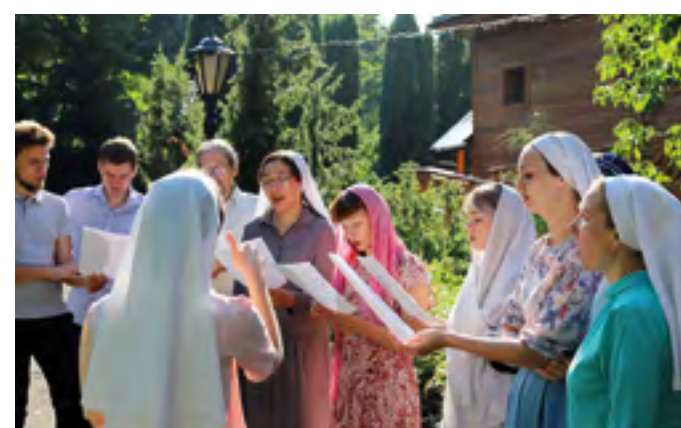
Спевка на открытом воздухе