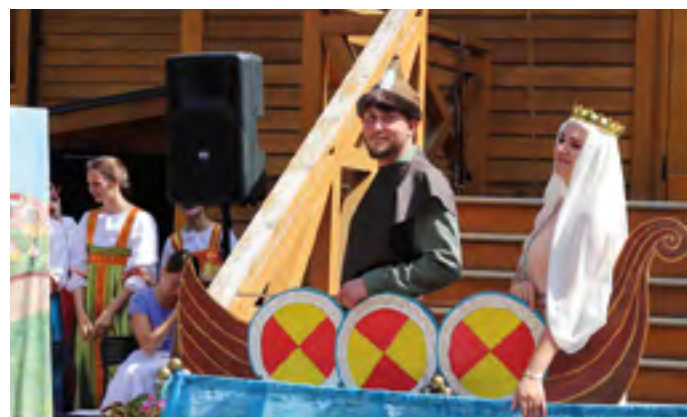
Фрагмент из спектакля «Князь Владимир»