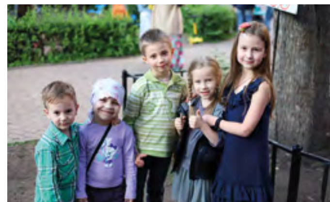
Наша церковная детвора