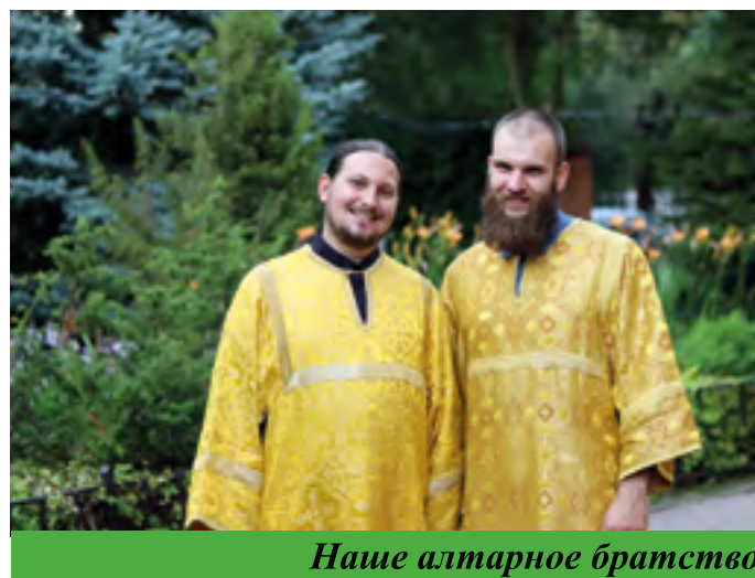
Наше алтарное братство